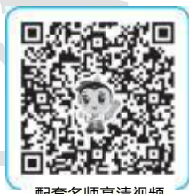
配套名师高清视频