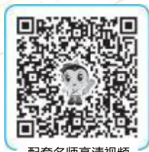
配套名师高清视频