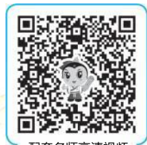
配套名师高清视频

【解析】沉默肺:哮喘发作时典型的体征是双肺可闻及广泛的哮鸣音 # 呼气音延长 # 但非常严重的哮喘发作 # 由于气道阻塞 # 哮鸣音反而减弱 # 甚至完全消失 # 表现为“沉默肺” # 是病情