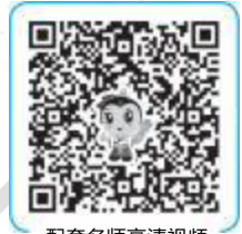
配套名师高清视频