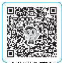
配套名师高清视频