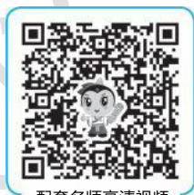
配套名师高清视频