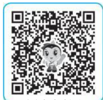
配套名师高清视频