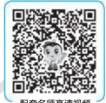
配套名师高清视频