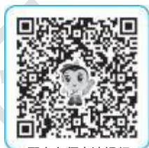
配套名师高清视频