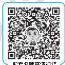
配套名师高清视频