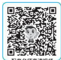
配套名师高清视频