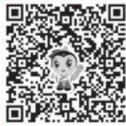
配套名师高清视频

【解析】小儿脏腑娇嫩 形气未充 具体表现在肌肤柔嫩 腠理疏松 气血未充 肺脾娇弱 肾气未固 神气怯弱 筋骨未坚等方面 五脏六腑功能皆属不足 尤其以肺、脾、肾三脏更为突出