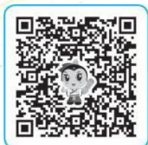
配套名师高清视频

【解析】经行乳房胀痛肝肾亏虚证症见经行或经后两乳作胀作痛，乳房按之柔软无块，月经量少，色淡，两目干涩，咽干，口燥，五心烦热，舌淡或舌红少苔，脉细数。治法为滋肾养肝和胃通络。 涉及考点 经行乳房胀痛的辨证论治