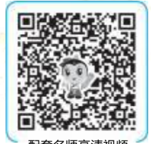
配套名师高清视频

86. 患者 女 65 岁 咳喘多年 2 天前外感后 症见喘逆上气 胸胀或痛 息粗 鼻扇 咳而不爽 吐痰稠黏 伴形寒 身热 烦闷 身痛 无汗 口渴 舌苔薄白 舌边红 脉浮数 治疗应选用的方剂是