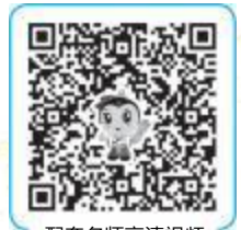
配套名师高清视频