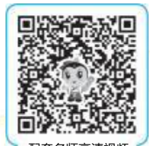
配套名师高清视频

【解析】淋病特点：通常以尿道轻度不适起病，数小时后出现尿痛和脓性分泌物，当病变扩展至后尿道时可出现尿频、尿急，检查可见脓性黄绿色尿道分泌物，尿道口红肿，因细菌感染引起，腹股沟区淋巴结可肿大。